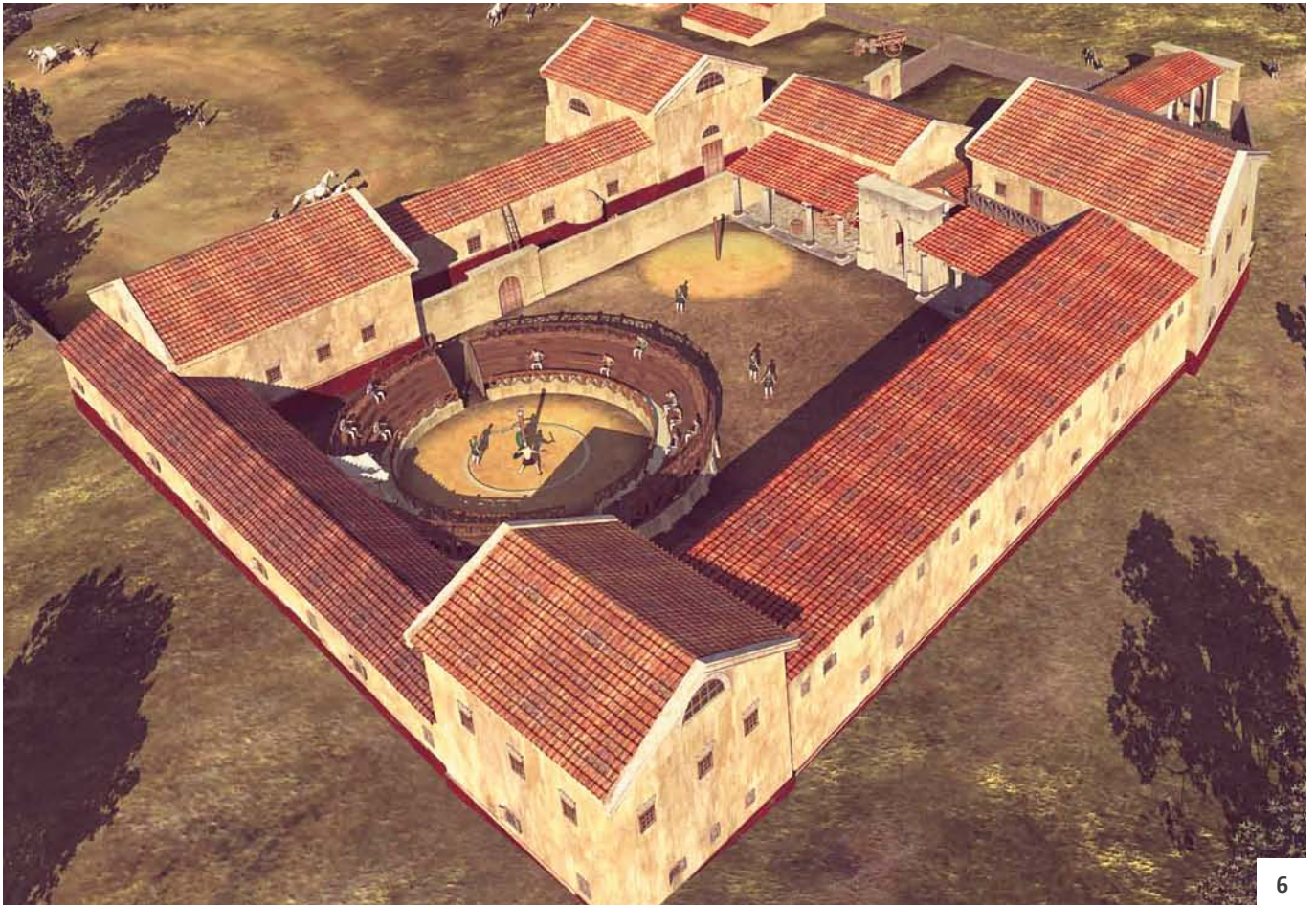
Abb. 6: Rekonstruktion der Gladiatorenschule basierend auf den Prospektionsdaten (Grafik: 7reasons, M. Klein)